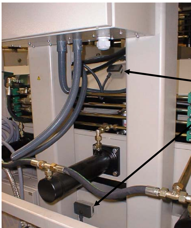
STB auf der oberen und der unteren Druckplatte

Wenn das Wasser zu heiß wird, d.h. heißer als die auf den STB eingestellte Temperatur, werden die STB automatisch die Heizfunktion ausschalten. Um die STB zurückzusetzen, drücken Sie auf den Knopf, der auf dem Deckel der beiden STB plaziert ist.